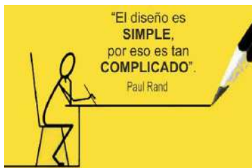
GRÁFICO: publicidad, mensaje comercial visual

PUBLICITARIO: Folletos y flyers, Catálogos, Carteles y posters, Vallas publicitarias, Tarjetas, Menús, Sobres, Logos, Packagin, envases y